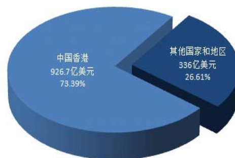
2015 内地接受外商直接投资情况图

内地政府自 1978 年开始实施改革开放政策以吸引外商投资,采用从沿海到内陆的推进策略。首批开放深圳、珠海等经济特区,然后逐渐深入到内陆地区。外商投资优惠政策以区域为导向。